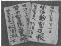
明治時代の醤油製造台帳