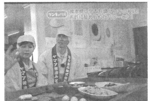
◎ 弊社の社員が酢を使った郷土料理をご紹介します

昨年12月TBS系「健康カプセル！ゲンキの時間」にて放送された『熊本県に学ぶ肝臓ゲンキの秘訣！』で酢が肝臓に良いという事で、当社の酢を取材いただきました。酢の中に含まれている酢酸、クエン酸が肝臓の代謝を促進。脂質やたんぱく質をエネルギーに変え、肝臓の働きを助けてくれるとの事。