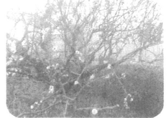
敷地内に咲いた梅

春の風が快い季節となりましたが、皆様いかがお過ごしでしょうか？ 当社の敷地内にある梅の木にも花が芽吹き始め、出勤の度にだんだんと春の足音を感じています。今号の松合便りでは全国ネットで取り上げられたお酢の話題から大河ドラマ『西郷どん』と糸各め(?)話題等、盛り沢山お送りします!(工場:古川)