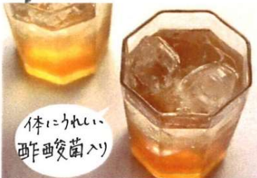
体にうれしい 酢菌(乳酸菌)