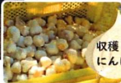
収穫したいんいく

いんいくは5月に無事収穫を終え、米や大豆は土をきれいに耕し、今年も豊かな実りとなるよう、種まきの時期を楽しみに待っているところです。