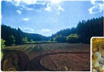
阿蘇波野の大豆畑

自社農場では、大豆・いんいく・米づくりが順調に進んでいます。エブリから丁寧に組み合わせ、気候や水管理にも配慮しながら、安心・安全の原料栽培に励んでいます。