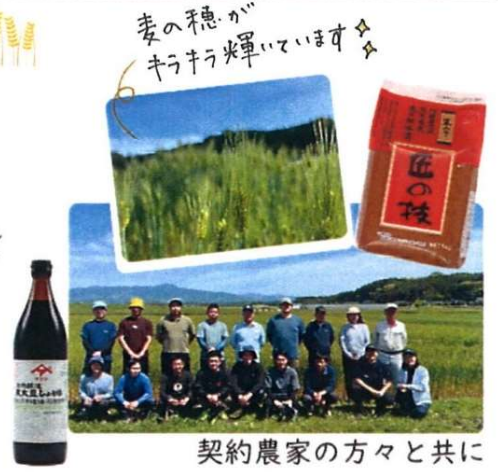
麦の穂がキラキラ輝いています♪

4月下旬に熊本県菊池市の麦の生産農家様を訪問しました。複数の畑を巡りながら、こだわりの農法を体感。手作業での雑草取りなど大変なご苦労と同時に、衛星データやAI解析を活用した農業に取り組まれる様子も知ることができました。青々とした麦畑はとても美しく、この麦が松合食品の味噌や醤油の原料となっていると思うと、有り難く愛おしい気持ちになりました。大変有意義な研修となりました。